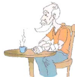
Blessures non traitées

Ce sont peut-être des signes de violence ou de négligence